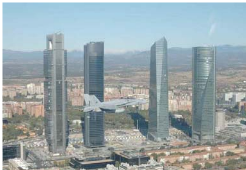
Tours Madrid Aréna