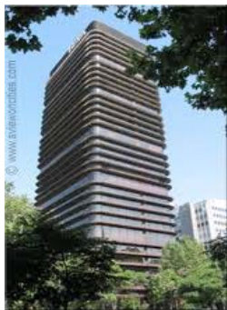
Banco de Bilbao