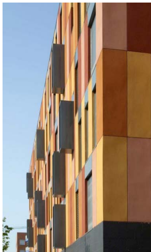
Logements à Vallecas Aguinaga y Asociados arquitectos

14:00 : Déjeuner dans le restaurant du Caixa Forum