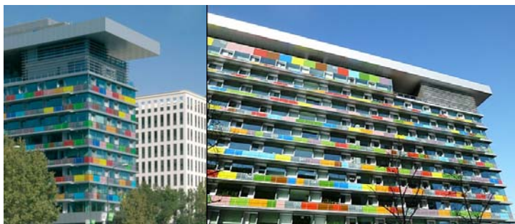
Institut National de la Statistique