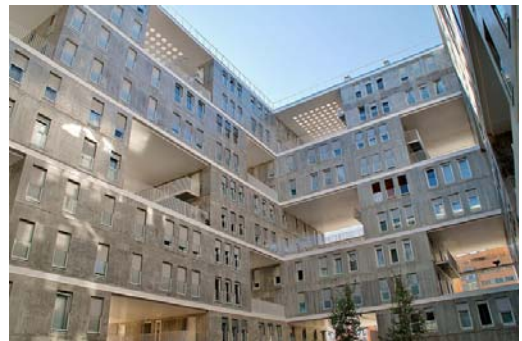
Logements MVRDV / LLEO