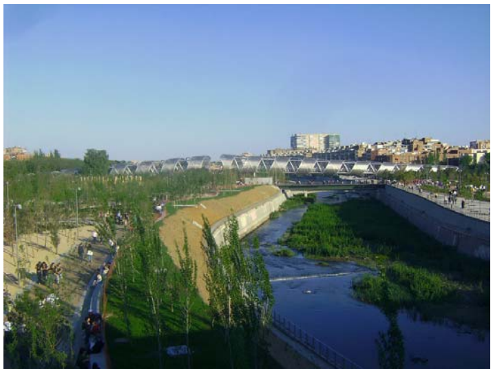
Parc Madrid Río avec Pont de Dominique Perrault