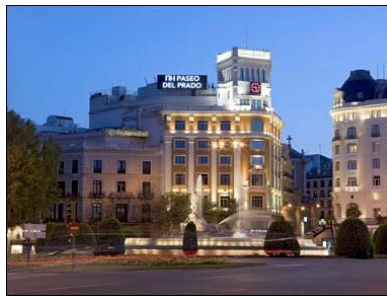
Hôtel NH Paseo del Prado