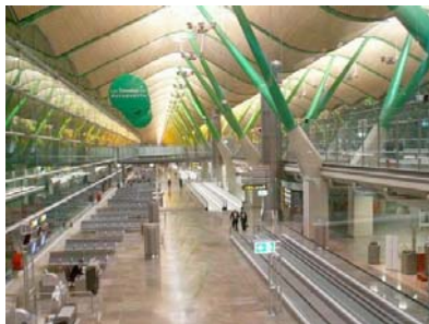
Terminal 4 de l'Aéroport