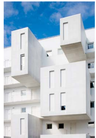
Logements à Carbanchel Dosmasuno, arquitectos